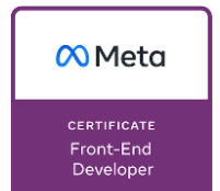
Meta Front-End Developer Certificate