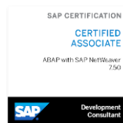
SAP Certified Development Associate - ABAP