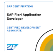
SAP Certified Development Associate - SAP Fiori Application Developer 2