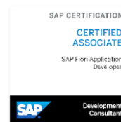
SAP Certified Development Associate - SAP Fiori Application Developer 1